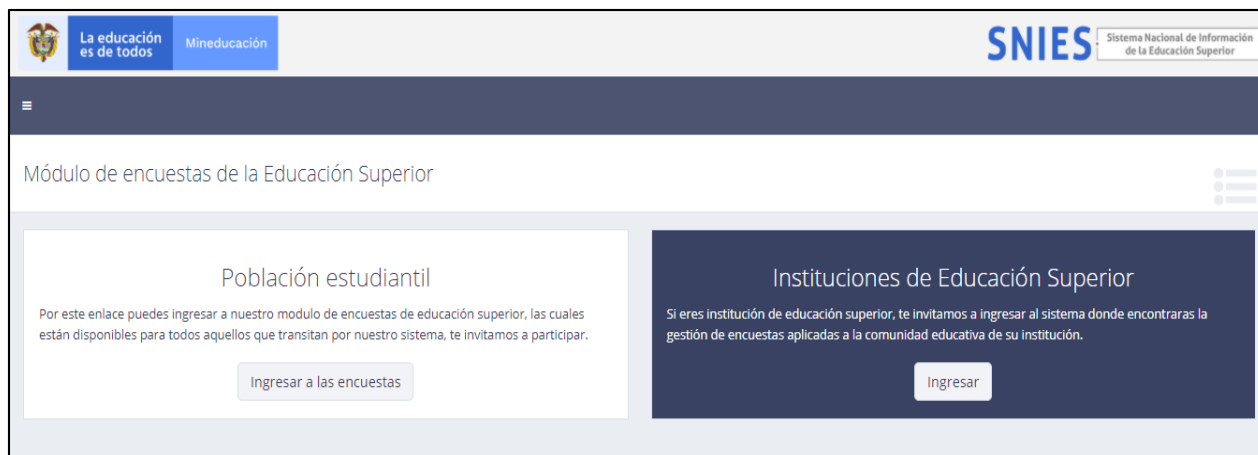
Grafica 1 Página Inicio de Encuestas

Al sistema de ENCUESTAS se ingresa mediante el siguiente URL http://encuestasole.mineducacion.gov.co/hecaa-encuestas/ y se obtiene la siguiente pantalla de inicio: